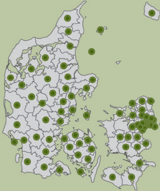
Antal kr. der årligt afsættes til direkte indkøb af kunst i kommunerne

Fagbladet Billedkunstneren har via en spørgeskemaundersøgelse spurgt landets 98 kommuner om, hvordan de prioriterer den professionelle billedkunst. 78 kommuner (80 procent) har valgt at deltage i undersøgelsen.